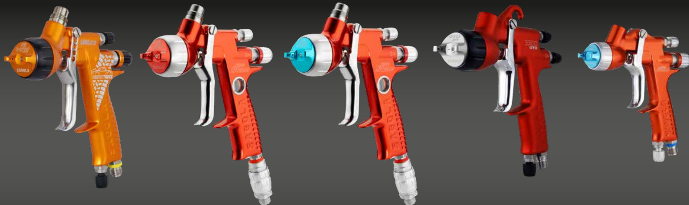
4600 TROPHY TRUCK LIMITED EDITION TITANIA PRO